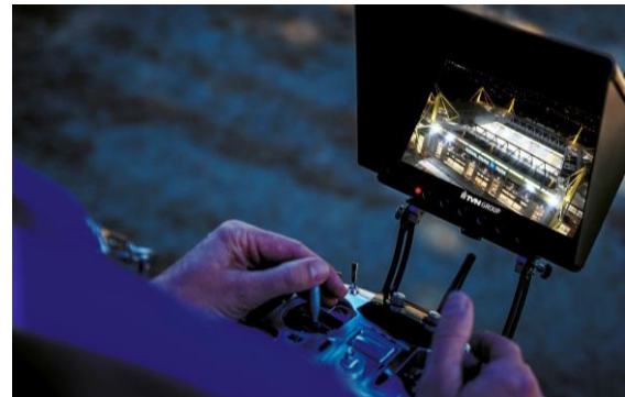
Steuerung des TVN Live-Copters beim BUNDESLIGA-Einsatz in Dortmund

Als Fullservice-Anbieter hat TVN neben professioneller Signalübertragung und kundenorientierter Bildgestaltung eigene Strukturen für die komplexen Genehmigungsverfahren entwickelt. Diese Workflows und das Netzwerk zu den Behörden haben sich lokal wie international als besonders wertvoll erwiesen, weshalb sich Einsätze der TVN Live-Copter innerhalb kurzer Zeit bei hochwertigen Live-Produktionen etablieren konnten.