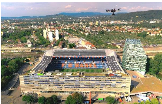
UEFA Nations League 2020 SCHWEIZ - DEUTSCHLAND in Basel